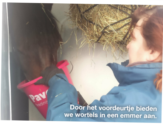
Door het voordeurtje bieden we wortels in een emmer aan.