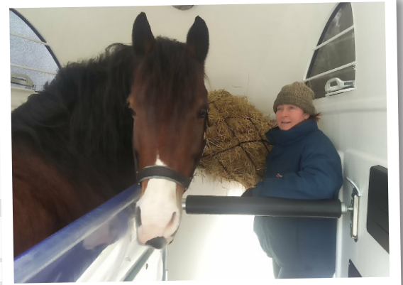
Het handige nieuwe sluitsysteem voor de stangen. Geen kettinkjes en haakjes meer nodig. Alle stangconstructies kunnen in geval van nood van buitenaf worden geopend.

Wij overnachten onderweg één keer in Denemarken. Timo overnacht in een grote weide waar hij kan rusten, eten en de benen strekken. Op stal zetten na een lange reis is niet aan te raden. Mocht er geen andere optie zijn, dan is het belangrijk om je paard na aankomst zeker een uur aan de hand te stappen. In ons geval rijden we de volgende dag in een uur of vier naar