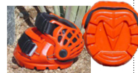
Renegade Viper is populair in endurance maar de vraag is of deze past om Timo's hoeven.