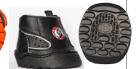
Equine Fusion is erg geschikt voor lange tochten maar ook wat zwaarder