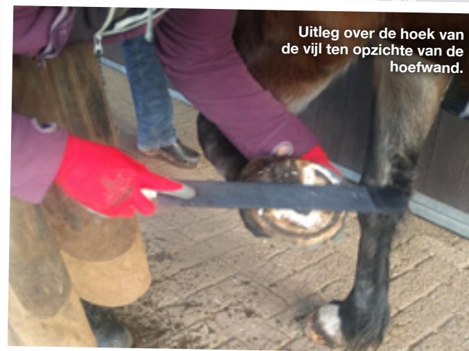
Uitleg over de hoek van de vijl ten opzichte van de hoefwand.