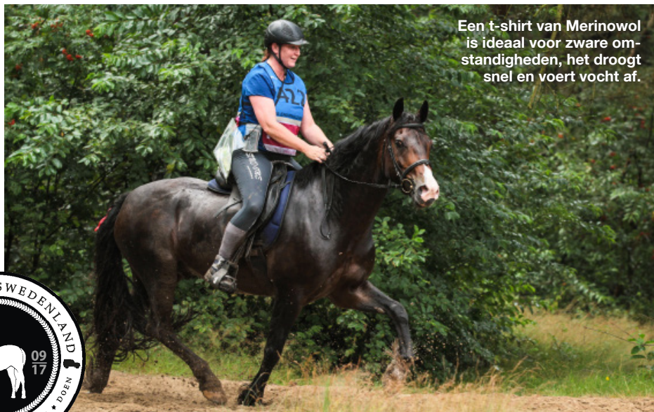
Een t-shirt van Merinowol is ideaal voor zware omstandigheden, het droogt snel en voert vocht af.