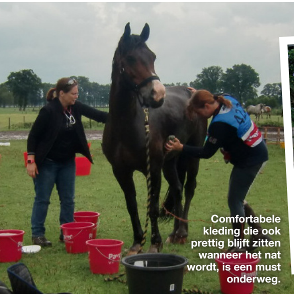
Comfortabele kleding die ook prettig blijft zitten wanneer het nat wordt, is een must onderweg.