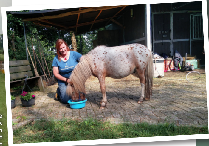
Save the earth, it's the only one with horses!

erger ruikt dan je paard... Tijdens die bak koffie raakte ik met Marjolein aan de praat over duurzaamheid in de paardenbranche. In outdoor-kleding is het heel normaal om met duurzaamheid bezig te zijn. De gebruikers van deze kleding zijn vaak natuurliefhebbers. Je hoort er als merk niet bij als je geen duurzame innovaties op de markt brengt. Eigenlijk is het best vreemd dat het in de paardenwereld niet gebruikelijk is om buitensportkleding aan te schaffen. De paardensport heeft zijn eigen merken. En hier wil