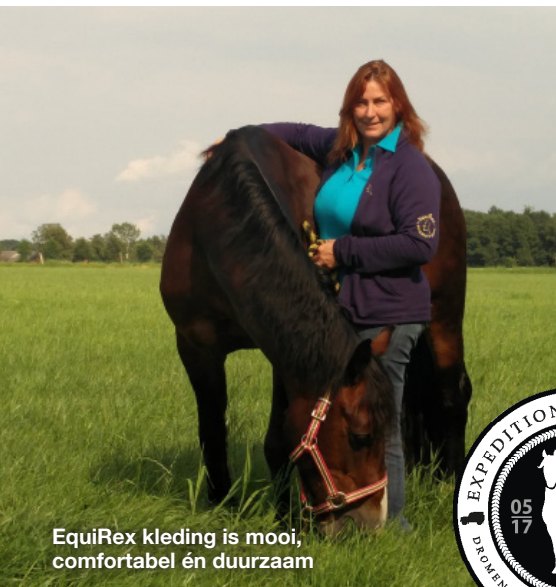
EquiRex kleding is mooi, comfortabel én duurzaam