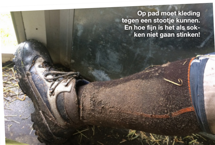
Op pad moet kleding tegen een stootje kunnen. En hoe fijn is het als sokken niet gaan stinken!

zij ziet het belang van goede kleding onderweg. Het kan je tocht maken of breken. Je wil immers niet dat het ergens schuurt, knelt of afzakt. Of dat je na een paar uur